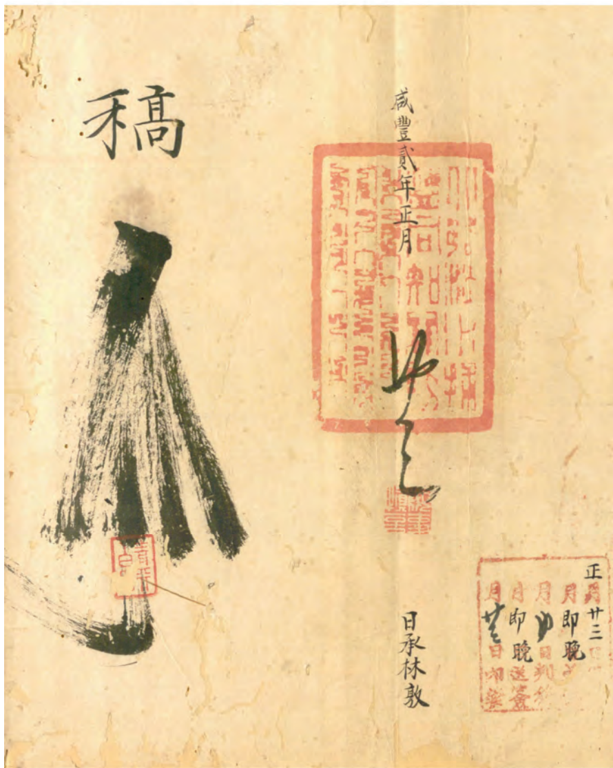
晚清北臺灣的社會風俗